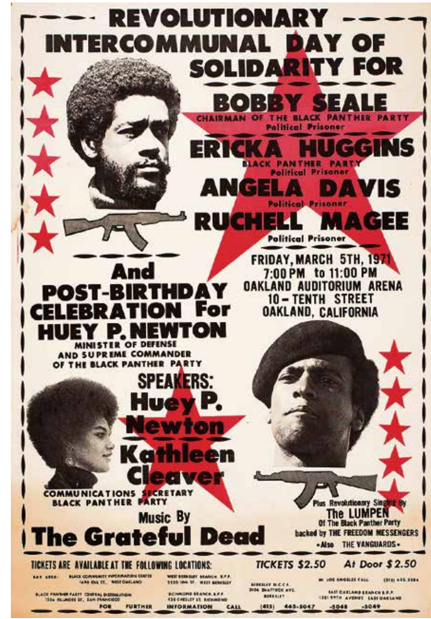
Unbekannt: Plakat für einen Tag der Solidarität mit inhaftierten schwarzen Aktivistinnen, 1971.