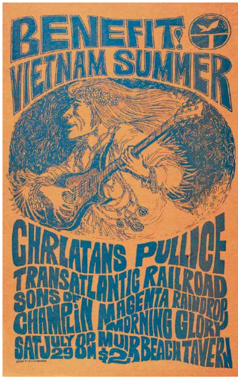
Charles Fleischman: Plakat für ein Vietnam-Benefitkonzert, 1967.