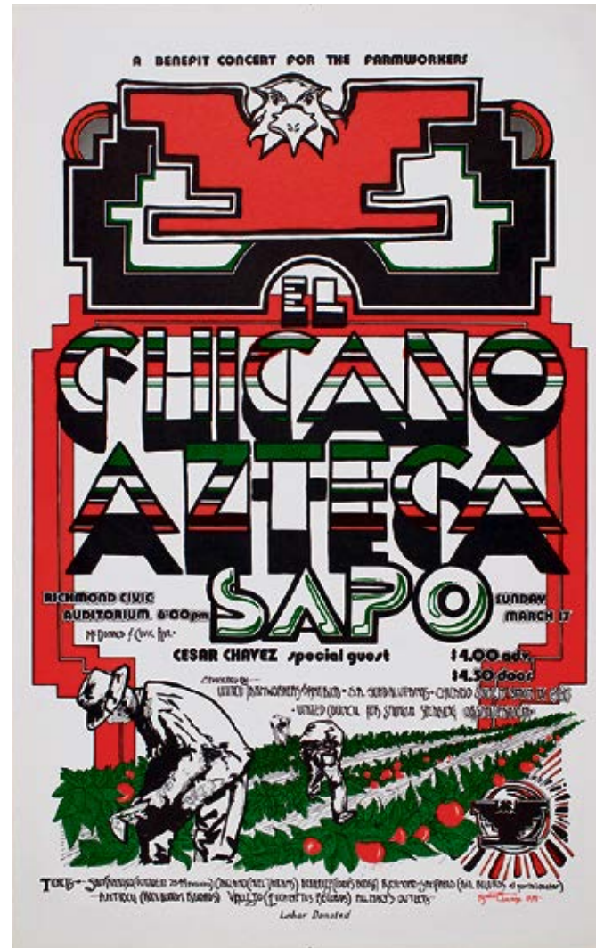
Ruben Guzman: Plakat für ein Benefizkonzert zugunsten der Landarbeitergewerkschaft, 1974.