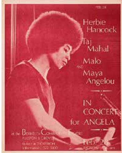
Unbekannt: Plakat für ein Konzert für die inhaftierte Kommunistin Angela Davis, 1972.

Es gibt eine direkte Beziehung zwischen den Drogen, die Teil der Befreiungsdees von «Sex, Drugs and Rock 'n' Roll» waren, und dem, was schliesslich aus dem Slogan gemacht wurde: Pornografie, Heroin und Heeey, Rock 'n' Rohoooo!!! – dieser stumpfsinnige Headbanging-Quatsch. «Sex, Drugs and Rock 'n' Roll» wurde zum Marketinglogan gegen alles, was der Ausdruck ursprünglich verkörpert hatte.