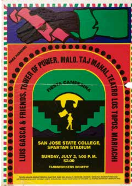
Ruben Guzman: Plakat für ein Benefizkonzert zugunsten der Landarbeitergewerkschaft, 1972.